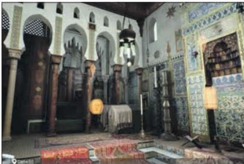
Même la mosquée de la maison Pierre-Loti a été numérisée pour se visiter de l'intérieur.

Le réseau des musées de Poitou-Charentes Alienor.org vient d'enrichir sa proposition de visite avec la création d'un musée virtuel. Les 40 musées du réseau ont déposé des objets visibles en trois dimensions, dans un parcours scénarisé, comme dans la réalité. Une nouvelle expérience est née.