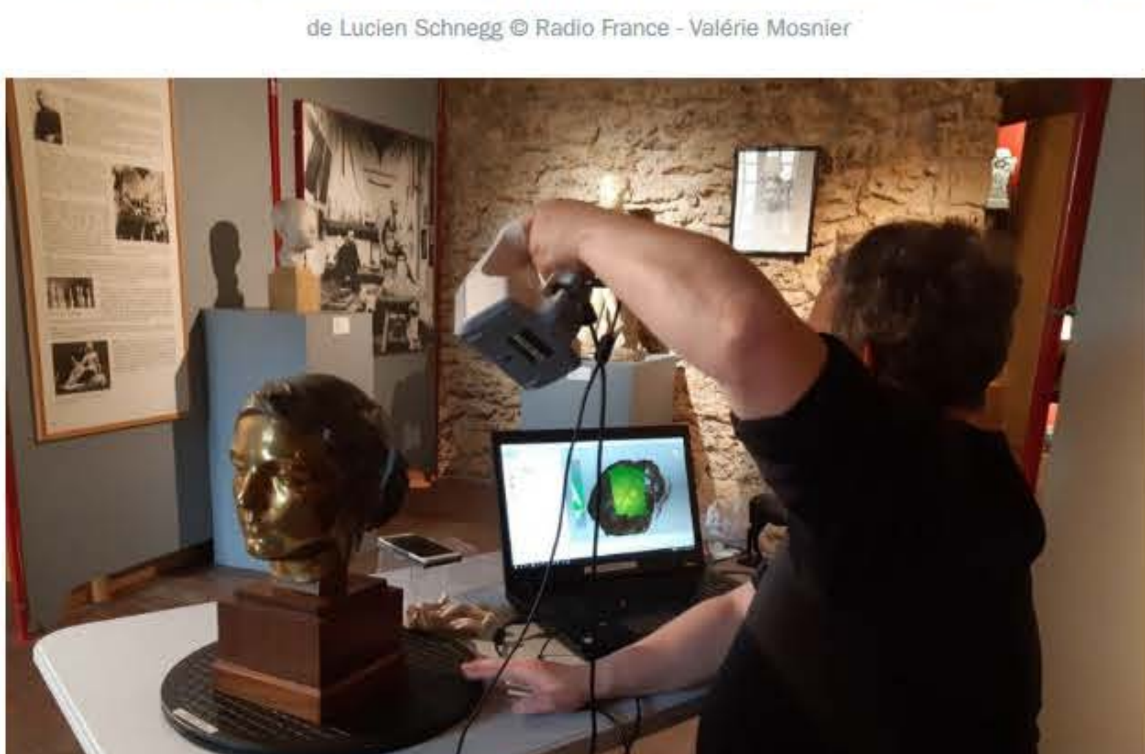
La numérisation de sculptures du musée Despiau-Wlérick à Mont-de-Marsan