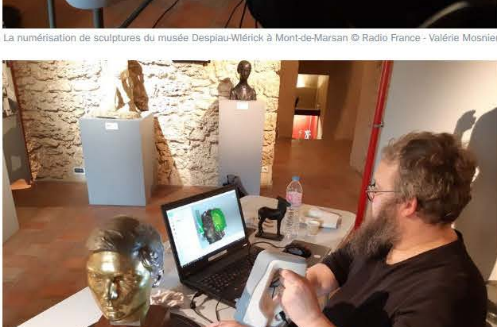
La numérisation de sculptures du musée Despiau-Wlérick à Mont-de-Marsan