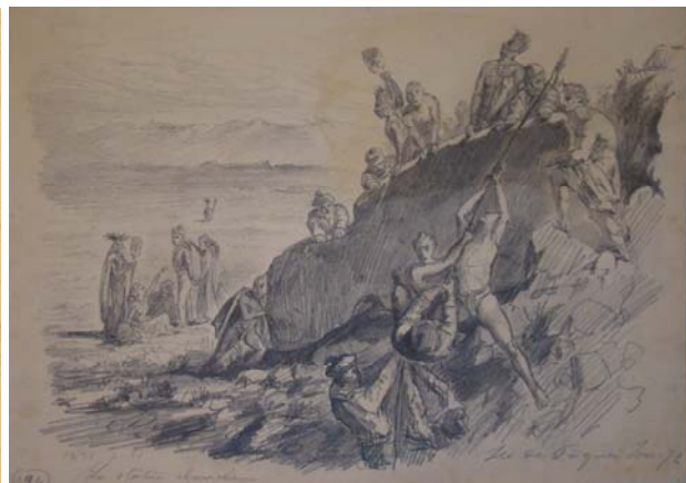
Pierre Loti, La statue chavirée, île de Pâques, janvier 1872 , crayon