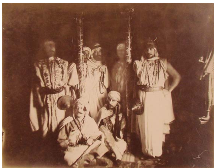
Fête arabe chez Pierre Loti le 8 novembre 1889, photographie

La maison de Loti à Rochefort, qu'il a passé sa vie à transformer, n'est pas seulement un espace théâtralisé destiné à surprendre ses amis, elle reflète plus profondément le personnage. Juxtaposition de reconstitutions d'escales plus ou moins heureuses de sa vie, elle est censée figer ces instants, décor fait pour le ressassement égoïste. La mosquée (1895-1897) est l'exemple le plus abouti de ces décors orientaux qui, selon le mot de Guitry, « n'est pas une mosquée, mais un désir ardent, très émouvant d'être une mosquée ». C'est en fait un tombeau dédié à la vie en fuite où Loti aime à s'ensevelir auprès de la stèle d'Aziyadé.