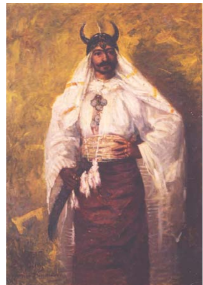
Edmond de Pury, Portrait de Loti en guerrier persan, 1895

Dès ses premiers voyages, Loti dessine et montre un réel talent. Formé enfant par Marie, sa sœur aînée, il cultive cet art et s'en sert comme moyen mnémotechnique, remplacé plus tard par la photographie, pour la rédaction de ses écrits. A partir de 1894, il opte pour celle-ci, apprise très tôt auprès de sa tante Corinne, et redécouverte par l'entremise du photographe Gervais Courtellemont. Il délaisse dès lors le dessin au profit de cette technique, où il se montre tout aussi doué, réalisant de véritables reportages durant tous ces voyages jusqu'en 1907. Comme photographe, il fait preuve d'une très grande spontanéité, en dépit de la lourdeur des contraintes techniques, et donne des images sans apprêt, bien éloignées de l'exotisme artificiel qui lui est habituellement reproché.