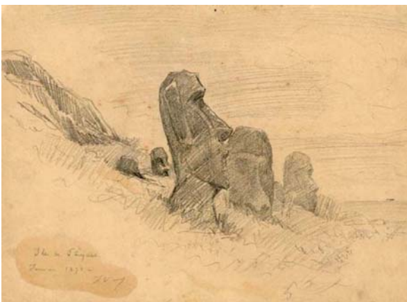
Pierre Loti, Sur le versant du cratère de Rano Raraku, île de Pâques, janvier 1872 , crayon graphite, mine de plomb

Pendant le voyage de la Flore dans le Pacifique (1871-1872), le jeune aspirant Julien Viaud assiste, lors de son bref passage à l'île de Pâques, à la destruction d'une population unique. Peu après, aux Marquises, il est de nouveau confronté et fasciné par la perte d'un monde et tâche, comme à l'île de Pâques, de conserver par le dessin la mémoire des lieux et des personnages. Cette expérience sera décisive dans sa conception du rôle joué par la civilisation occidentale dans le monde. Selon lui, elle n'apporte que la déchéance et la mort. Ce sera désormais le message qu'il s'efforcera de transmettre.