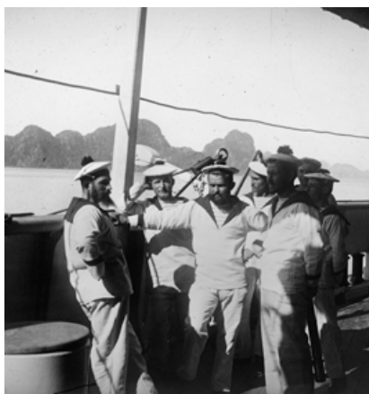
Pierre Loti, Matelots sur le Redoutable dans le port de Hong Hai, baie d'Along, Tonkin, janvier 1902 , retraitage d'une plaque de verre

Le « Loti mondain » a marqué les esprits et donné lieu à d'acérées critiques sans doute motivées par la jalousie. Il est vrai que pour un homme issu d'une famille de petite bourgeoisie de province quasiment ruinée par une sombre affaire financière dans laquelle le père avait été abusivement mêlé, l'ascension sociale est inouïe. Ces amitiés ne sont pas que de convenance. De réels liens d'affections réciproques unissent Loti et Sarah Bernhard, Elisabeth de Roumanie ou Alice de Monaco ; il en va différemment avec les reines d'Espagne et de Grande-Bretagne où l'admiration de l'écrivain seule prévaut.