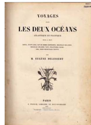
Eugène Delessert, Voyage dans les deux océans Atlantique et Pacifique 1844-1847 , Franck Paris, 1848

Loti attribue, dans son récit autobiographique le Roman d'un enfant (1890), sa découverte et son attirance pour Tahiti à la lecture de l'ouvrage Voyage dans les deux océans Atlantique et Pacifique 1844-1847 d'Eugène Delessert offert par son frère Gustave. Il décrit sa fascination pour le portrait de la reine Pomaré et l'illustration légendée « Jeunes filles tahitiennes ». Que les gravures qui agrémentent le récit soient un assemblage hétéroclite de reprises assez maladroitement d'illustrations anciennes n'a guère d'importance. Ce qui compte, c'est l'évocation offerte au jeune lecteur d'une île lointaine et paradisiaque où vit son aîné. Loti a peut-être exagéré le rôle de ce livre, relique liée à Gustave, mais il n'est pas interdit d'y voir les prémices de sa vie de voyageur.