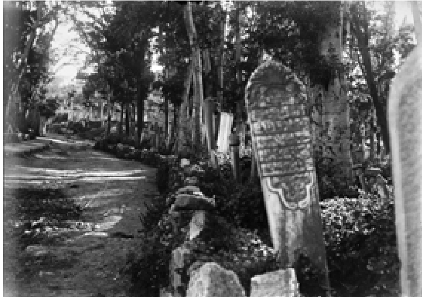
Pierre Loti, Cimetière d'Erdinekapi , retirage d'une plaque de verre

A l'exact opposé, se situe le Loti ottoman, turcophile sans compromis qui inaugure en 1879, par son premier roman Aziyadé , une passion jamais démentie pour les Turcs. Par la suite, il écrit des ouvrages où la fiction laisse le pas aux témoignages souvent polémiques sur ce qu'il considère comme sa deuxième patrie. Aussi, à Constantinople, Loti est vêtu mais non déguisé en Turc. Ici, il ne joue pas de rôle mais se veut un vrai bourgeois stambouliote, marquant ostensiblement son engagement sans faille et parfois aveugle à défendre l'empire Ottoman - attitude toujours controversée presque un siècle après sa mort.