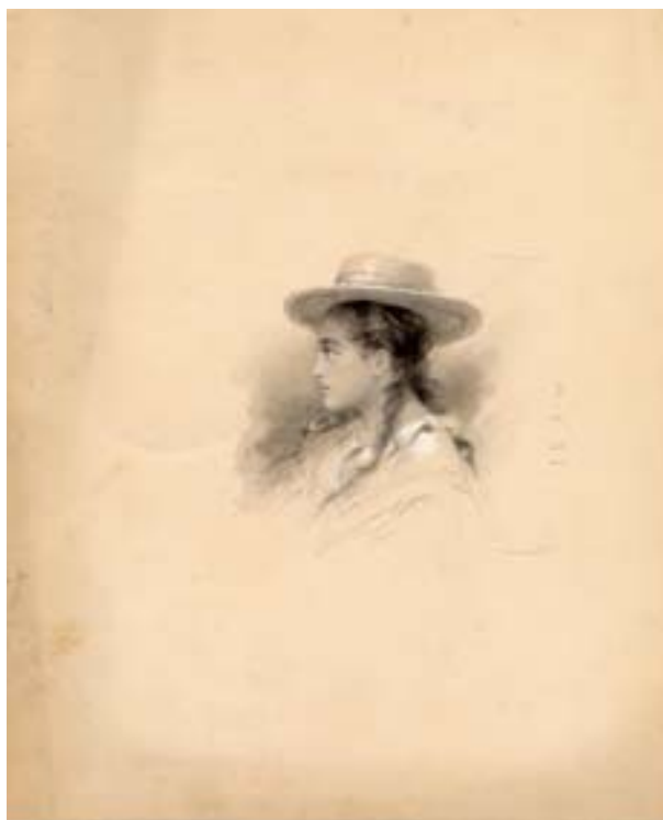
Pierre Loti, Profil de Rarahu , pour une édition illustrée du Mariage de Loti , en 1898 chez Calmann-Lévy, lavis d'aquarelle, fusain, rehauts de blanc