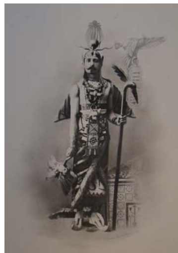
Pierre Loti en costume d'Osiris 1887, héliogravure

Très jeune, Loti montre un goût marqué pour le jeu et le déguisement qui ne le quittera plus alors même qu'il est devenu officier de marine et académicien. D'être militaire et « immortel » ne l'empêche pas de s'adonner à de nombreuses extravagances. Il cultive à dessein les ambiguïtés et se moque des critiques, faisant ainsi preuve d'un bel esprit de liberté ou d'une grande innocence. Certains de ses accoutrements sont restés célèbres, comme le costume d'Osiris porté au bal donné par Juliette Adam le 20 juillet 1887. Cette apparente frivolité adoucit l'angoisse de la mort, liée chez lui à une jeunesse marquée par les deuils. Mais le jeu, en dépit des apparences, connaît ses limites. Loti ne transige ni avec le respect dû à la Marine, ni avec l'amour voué à sa mère. Si l'habit d'académicien lui importe assez peu, l'uniforme n'est jamais un déguisement et il n'existe pas de costume pour exprimer la piété filiale.