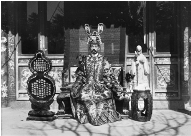
Pierre Loti en costume de dignitaire chinois, Pékin 1900-1901, retirage d'une plaque de verre

Les séjours de Loti à Pékin entre octobre 1900 et mai 1901, à la fin de la révolte des boxers, donne lieu au récit Les derniers jours de Pékin , qui résume parfaitement l'état d'esprit de l'auteur. Il décrit les destructions et stigmatise les effets déplorables des visées des puissances étrangères sur un pays de très vieille civilisation qu'elles poussent à un déclin irrémédiable. Ce constat, toutefois, ne l'empêche pas de rendre compte avec force détails de la barbarie des insurgés et de signifier l'antipathie qu'il éprouve à l'égard des Chinois. En revanche, il trouve un décor à sa démesure. Lui, qui ne rêve que de théâtre, découvre avec la Cité