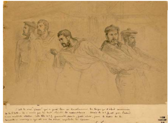
Pierre Loti, Cinq études de marins, 1885, mine de plomb

Comme officier de marine, Loti est très respectueux et proche des hommes d'équipage, ce qui lui vaut une grande estime de ceux-ci. A l'encontre d'une tradition bien établie, lui, qui appartient au « grand cadre » des officiers, ne dédaigne pas la fréquentation des non gradés. C'est aller aux antipodes de la société que d'avoir commerce avec des princesses lointaines et de fréquenter les ouvriers de la mer. Ce grand écart social, très peu conventionnel, relève aussi d'une forme d'exotisme.