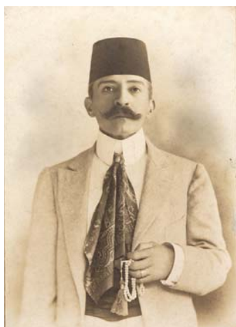
Figure emblématique de l'exotisme en littérature du dernier quart du 19 e siècle et du début du 20 e siècle, Julien Viaud dit Pierre Loti (1850-1923) doit sa notoriété à son travail d'écriture. Mais il ne peut être réduit à cette seule dimension. Sa vision du monde s'articule autour de deux axes intimement liés : l'authenticité et la perte de celle-ci qui entraîne la mort des civilisations.

Studio Succursale Phébus [Boghos Tarkulvan], Sikedii-stamboul, Loti en Turc.