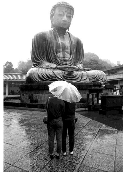
Le Daibutsu de Kamakura

Dominique Philippe Bonnet est initié très jeune à la photographie et réalise ses propres tirages dès l'âge de dix ans. Dans les années 80, il part pour Londres où il travaille à l'Institut Français du Royaume-Uni. Il continue de pratiquer assidûment la photographie et devient correspondant en Grande-Bretagne pour la revue suisse FOTOGRAFIA OLTRE.