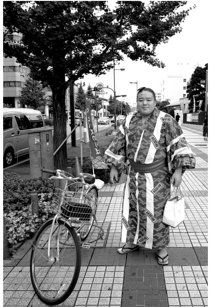
Sumo devant le Kokugikan, Tokyo

Visite guidée pour les groupes sur réservation préalable trois semaines à l'avance (Tél : 05.46.82.91.60)