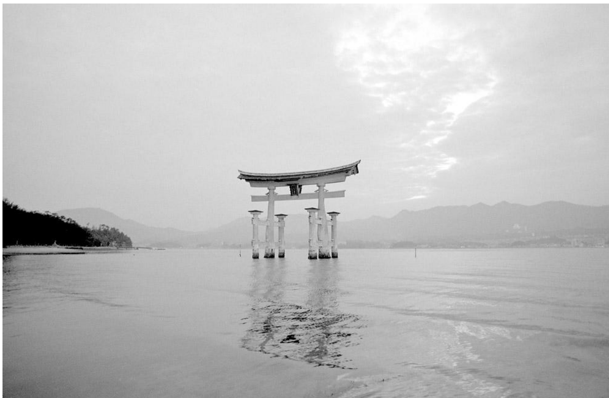
Le grand torii flottant du sanctuaire d'Itsuku-shima