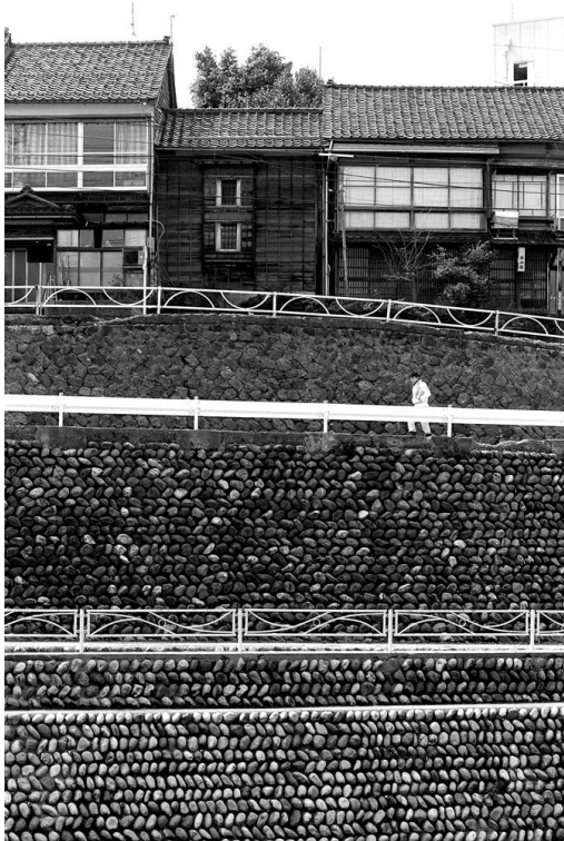
Scènes de rue à proximité de Kurashiki

Il expose au cours des années 80-90 dans un certain nombre de galeries londoniennes (ChalkFarm Gallery, Taranman Gallery, etc.) et publie dans des revues britanniques de photographie dont le prestigieux BRITISH JOURNAL OF PHOTOGRAPHY.