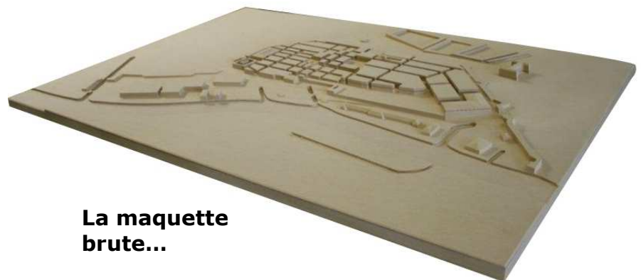
La maquette brute...